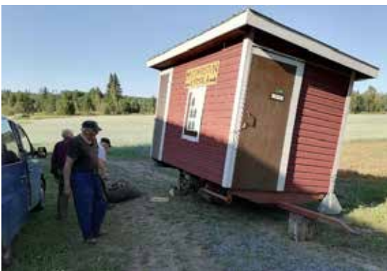
Rompotorille vietävästä ulkohuussista oli rengas puhjennut, ja siihen oli saatu tilalle uusi pyörä ennen kuin ehdittiin apua edes pyytää.