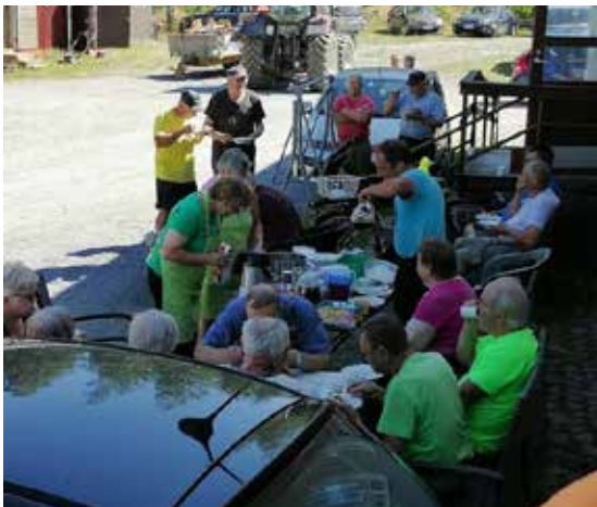
Rompotorin valmistelupuuhia edelliseltä päivältä leppoisissa tunnelmissa.