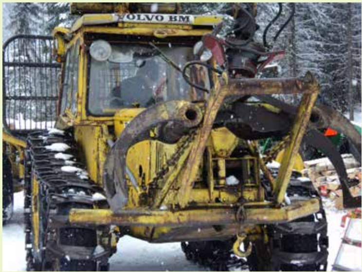
Metsäkone Volvo Nalle hankittiin 1979.

Hannun suunnitelmat eivät pitäneet, vaan kävi päinvastoin: Metsätöihin ehtiminen lykkääntyi puimurin hankkimisen takia. Niin-