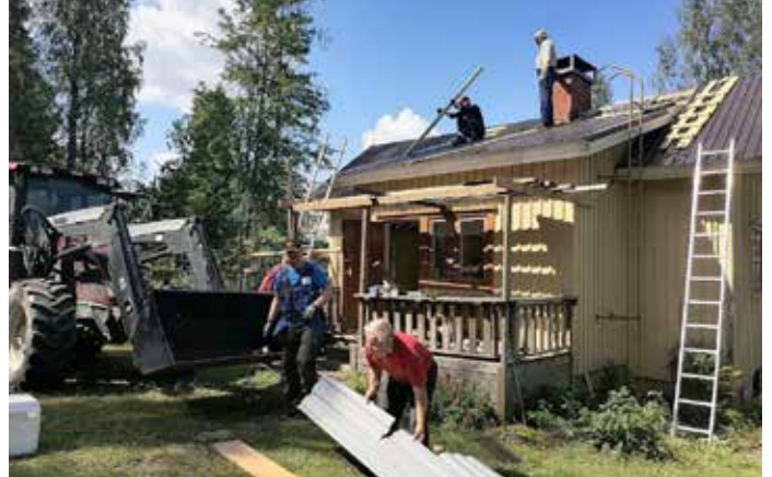
Kuusiston talkoissa Suomen kesä oli kauneimmillaan.