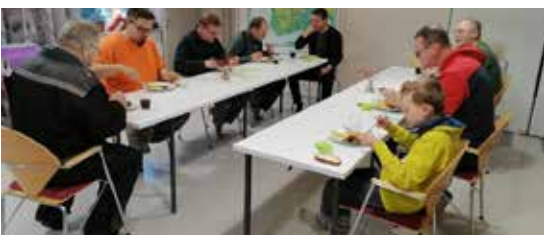
Joskus kuulee, ettei kylissä olisi nuoria talkoolaisia. Viime vuonna jääkiekkokaukalon pystytystalkoissa oli hienosti nuorempaakin väkeä. Ja ruokapalkka maittoi.