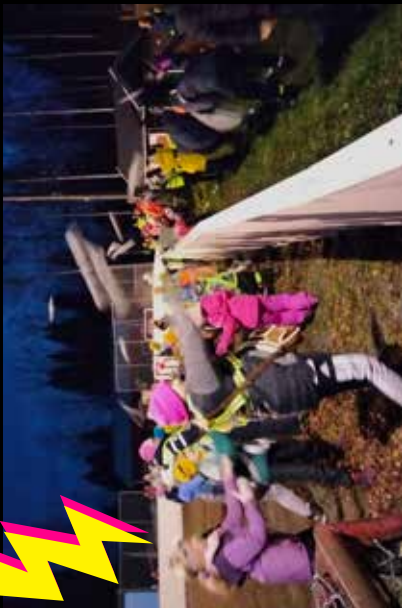
29.10. vietettiin viidettä HOHTOA PIMEÄSSÄ -tapahtumaa. Tuttuun tyyliin ilta alkoi yhteisellä leikillä, aikuiset vastaan lapset. Häntäpalojen heitto oli hauskaa, ja lapset voittivat nopeudellaan ja rehellisyydellään - ja ehkä myös ylivoimalla.