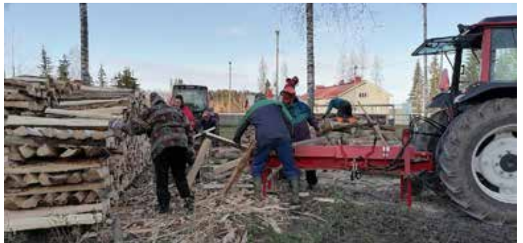
Puutalkoissa kävi kova kuhina ja valmista tuli.