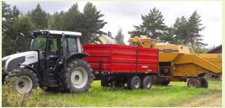
Sampo –puimuri vuosimallia 1980.