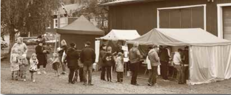
Viidettä kertaa järjestettävä valtakunnallinen Lähiruokapäivä 11.09.2021 veti Ekojärven tilalle runsaasti syyspäivästä, lähituotteista ja eläimistä nauttivia.