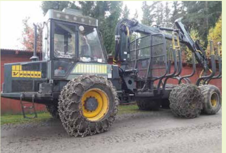
Ponsse vuosimallia 1995.