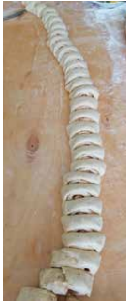
Pullanalku jos toisenkin. Kahvitukseen kas-tettavaa.